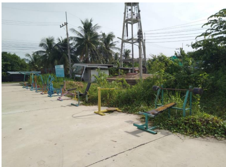
ลานกีฬา หมู่ที่ ๒ บ้านบางกะโต บริเวณศาลาอเนกประสงค์ หมู่ที่ ๒ จำนวน ๑ แห่ง มีอุปกรณ์เครื่องออกกำลังกาย จำนวน ๑๐ เครื่อง