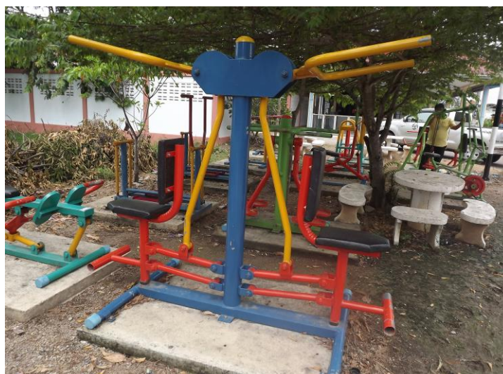
ลานกีฬา หมู่ที่ ๘ บ้านกำแพงใต้ บริเวณข้างศาลาอเนกประสงค์ หมู่ที่ ๘ จำนวน ๑ แห่ง มีอุปกรณ์เครื่องออกกำลังกาย จำนวน ๕ เครื่อง