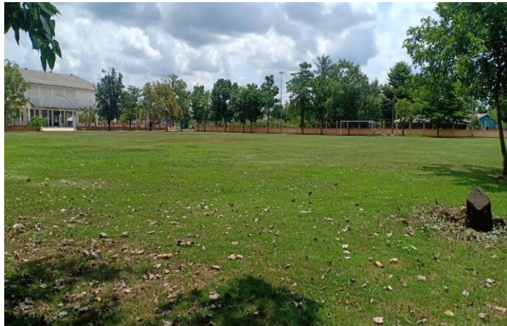
สนามฟุตบอล โรงเรียนวัดหนองอ้อ จำนวน ๑ สนาม