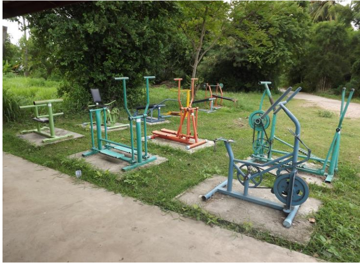
ลานกีฬา หมู่ที่ ๙ บ้านโรงทีบ บริเวณข้างศาลาอเนกประสงค์ หมู่ที่ ๙ จำนวน ๑ แห่ง มีอุปกรณ์เครื่องออกกำลังกาย จำนวน ๑๐ เครื่อง