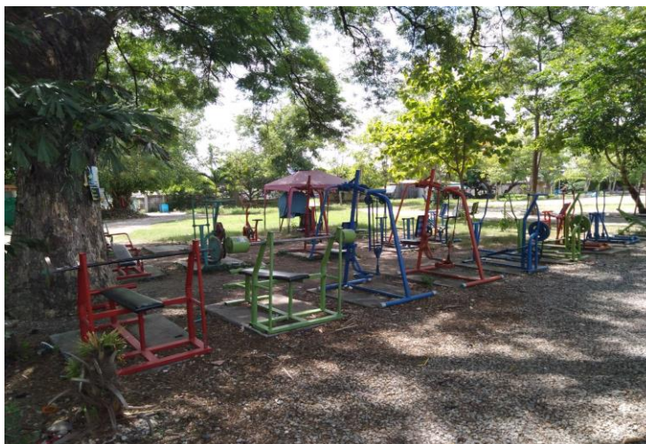
ลานกีฬา หมู่ที่ ๗ บ้านกำแพงเหนือ (หน้าวัดกำแพงเหนือ) จำนวน ๑ แห่ง มีอุปกรณ์เครื่องออกกำลังกาย จำนวน ๒๐ เครื่อง