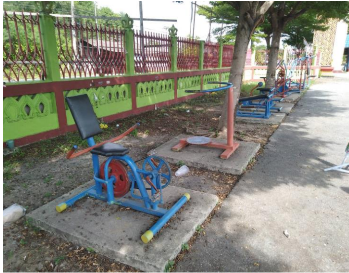
ลานกีฬา หมู่ที่ ๑ บ้านบางกะโต บริเวณวัดบางกะโต จำนวน ๑ แห่ง มีอุปกรณ์เครื่องออกกำลังกายจำนวน ๑๐ เครื่อง