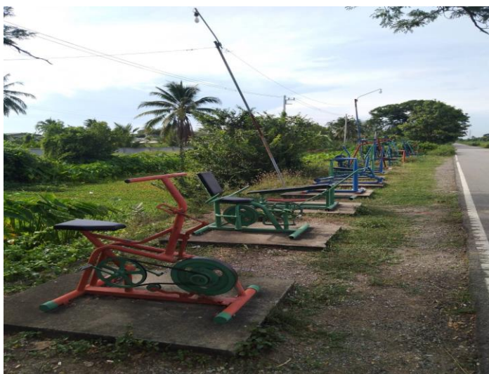
ลานกีฬา หมู่ที่ ๓ บ้านหนองอ้อ บริเวณสะพานข้ามคลองชลประทาน จำนวน ๑ แห่ง มีอุปกรณ์เครื่องออกกำลังกายจำนวน ๑๕ เครื่อง