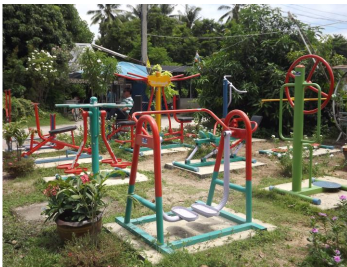
ลานกีฬา หมู่ที่ ๖ บ้านด่าน บริเวณริมถนนสายบ้านสิงห์ – น้ำหัก จำนวน ๑ แห่ง มีอุปกรณ์เครื่องออกกำลังกาย จำนวน ๑๐ เครื่อง