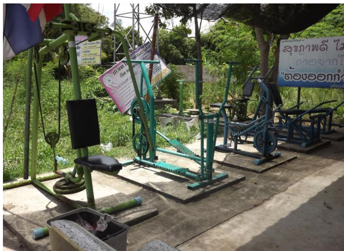
ลานกีฬา หมู่ที่ ๑๐ ตำบลบ้านสิงห์ บริเวณข้างศาลาอเนกประสงค์ หมู่ที่ ๑๐ จำนวน ๑ แห่ง มีอุปกรณ์เครื่องออกกำลังกาย จำนวน ๑๐ เครื่อง