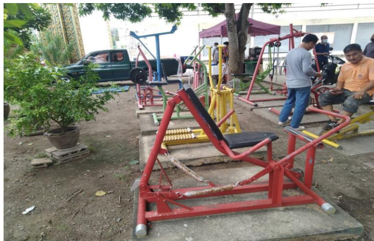
ลานกีฬา หมู่ที่ ๔ บ้านสิงห์ บริเวณลานวัดบ้านสิงห์ จำนวน ๑ แห่ง มีอุปกรณ์เครื่องออกกำลังกาย จำนวน ๑๐ เครื่อง