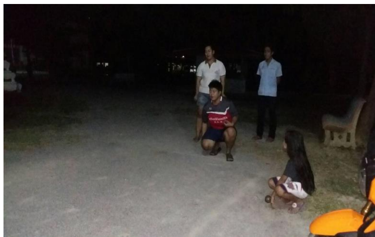
สนามเปตอง ลานวัดบางกะโต จำนวน ๑ สนาม