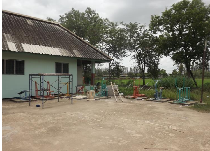
ลานกีฬา หมู่ที่ ๑๑ บริเวณข้างศาลาอเนกประสงค์ หมู่ที่ ๑๑ จำนวน ๑ แห่ง มีอุปกรณ์เครื่องออกกำลังกาย จำนวน ๑๐ เครื่อง