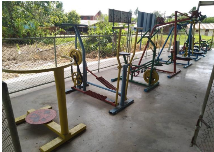
ลานกีฬา หมู่ที่ ๑๒ บ้านทุ่ง บริเวณข้างศาลาอเนกประสงค์ หมู่ที่ ๑๒ จำนวน ๑ แห่ง มีอุปกรณ์เครื่องออกกำลังกาย จำนวน ๑๐ เครื่อง