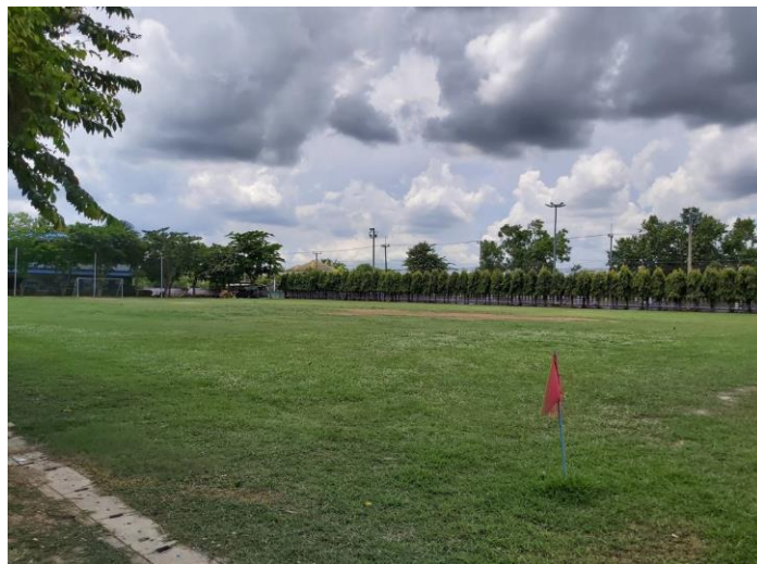
สนามฟุตบอล โรงเรียนวัดบางกะโต จำนวน ๑ สนาม