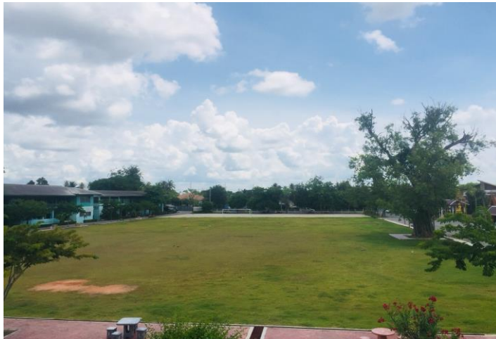
สนามฟุตบอล โรงเรียนวัดชุมชนวัดกำแพงใต้ จำนวน ๑ สนาม