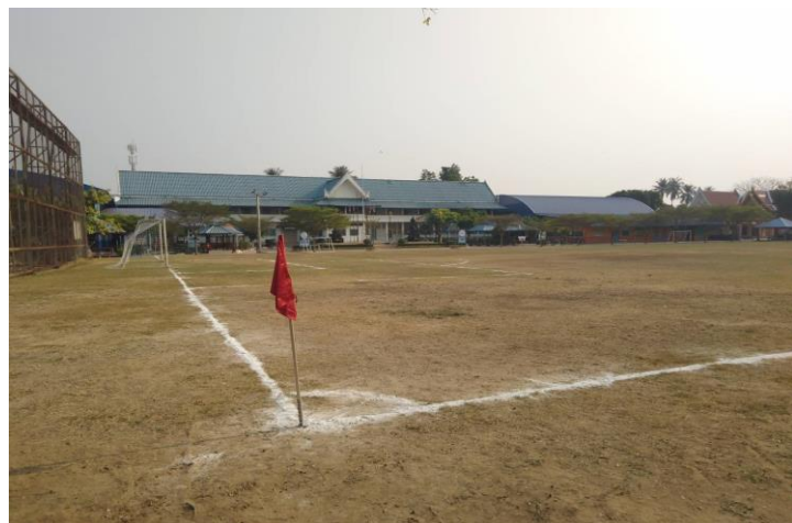
สนามฟุตบอล โรงเรียนอนุบาลโพธาราม จำนวน ๑ สนาม